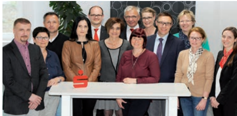
Der Pädagogische Beirat der Kreissparkasse Kusel